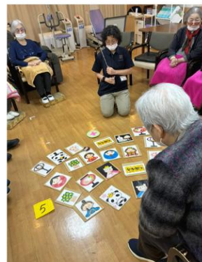
ひな祭り神経衰弱ゲーム